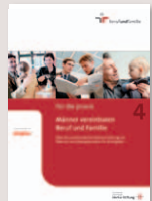
Männer vereinbaren Beruf und Familie