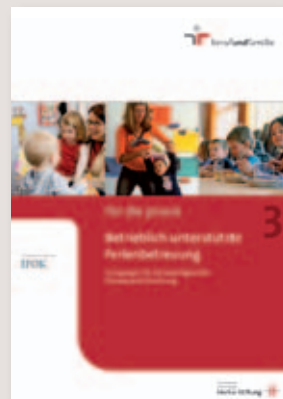
Betrieblich unterstützte Ferienbetreuung