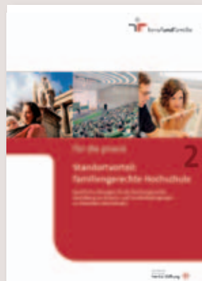
Standortvorteil: familien-gerechte Hochschule